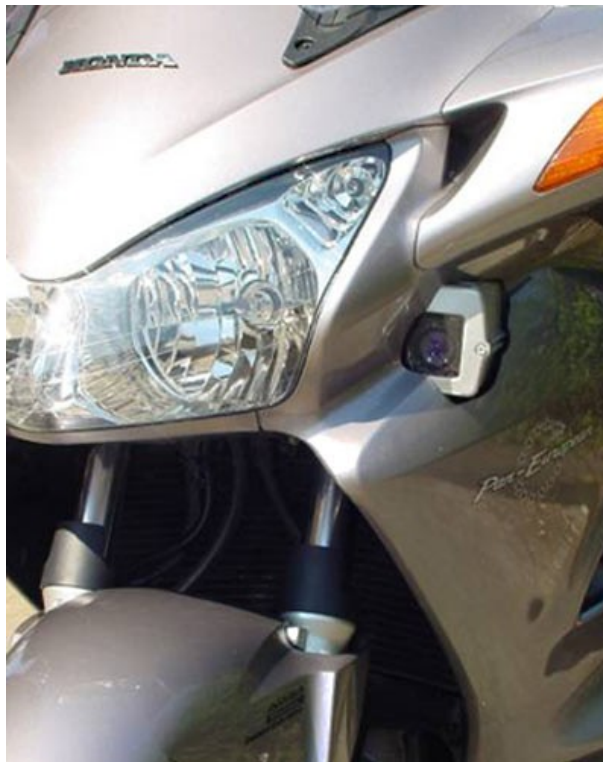
Prudence et bonne route

Les forces de l'ordre ont une imagination débordante. On connaissait déjà les voitures banalisées dissimulant des radars, c'est au tour désormais des motos de transporter des radars. L'expérience est menée par la police fédérale belge qui vient de mettre en service sur les autoroutes E40 et E411 des motos banalisées. Ces Honda Pan Européen dissimulent sous leur clignotant avant gauche une caméra reliée à un dispositif d'enregistrement des infractions. Ne vous réjouissez pas trop vite ; la France aurait déjà acheté 5 exemplaires de cette moto-espion.